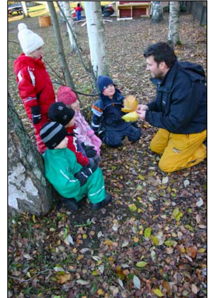
Att öka kunskapen om naturvetenskap och framför allt på området klimat och hållbar utveckling är målet med projektet som innefattar förskolepersonal i tio kommuner samt forskare och didaktiker vid HiG och vid Lunds universitet. (Bilden från annan plats.)