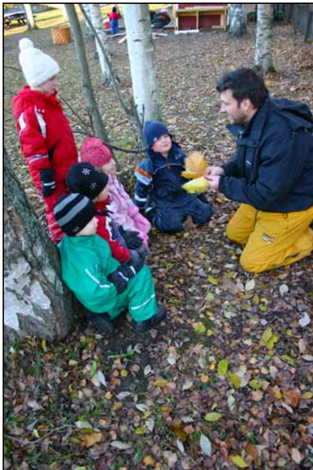
Att öka kunskapen om naturvetenskap och framför allt på området klimat och hållbar utveckling är målet med projektet som innefattar förskolepersonal i tio kommuner samt forskare och didaktiker vid HiG och vid Lunds universitet. (Bilden från annan plats.)