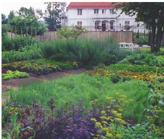
Wij Trädgårdar i Ockelbo kommer att utgöra basen för HiG:s nya trädgårdsmästarprogram med inriktning på välbefinnande och hälsa. Bättre miljö kan man knappast tänka sig.

– Det är en mångvetenskaplig utbildning med både pedagogik, estetik såsom form, gestaltning och färglära och rent praktiska kunskaper.