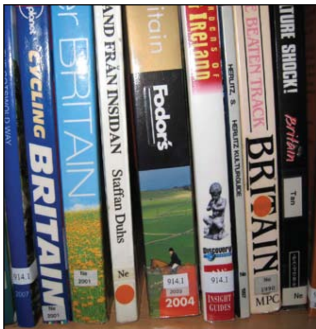
Dewey Decimal Classification är det utan konkurrens mest använda klassificeringssystemet i världen.

Kungliga biblioteket kommer att hålla i utbildning inför övergången. Hela bibliotekspersonalen kommer att få en endagsutbildning, och en till två personer kommer att få en veckas kurs för att själva kunna klassificera. Själv har jag kunskaper i systemet sedan tidigare, vilket gör att vi redan har haft och kommer fortsätta att ha information och undervisning för vår personal. Jag sitter också med i sakkunniggruppen för Deweyprojektet vid Kungliga biblioteket.