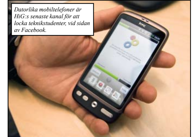
Datorlika mobiltelefoner är HiG:s senaste kanal för att locka teknikstudenter, vid sidan av Facebook.

Vet du inte vad en "app" är? Då befinner du dig sannolikt inte i åldersspannet 18–23 år.