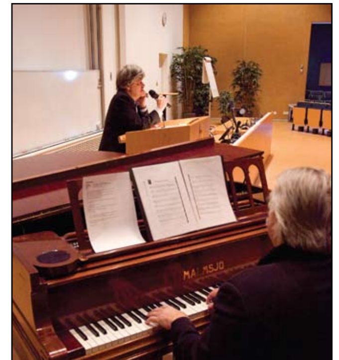
M.A. Numminen sjöng sig in i svenska folkets sinnen med "Som en gumiboll..." på 1970-talet. Den säregit spruckna sången till trots är han en av Finlands främsta experter på finsk tango. Pianot trakterades av ständige ackompanjatören Pedro Hietanen.

Och att tangon gjort mycket nytta i Finland bevisas enligt Numminen att landets invånarantal gått från 5 miljoner till 6 miljoner från tangoadoptionen.