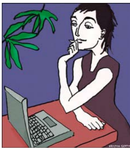
Hur formuleras akademiska texter?

Sedan många år finns skivarkverkstäder etablerade på svenska lärosäten. Vid HiG har behov och efterfrågan lett till att vi är representerade i ett nationellt nätverk för skivarkverkstäder. Nätverkets uppgift är att utveckla och utbyta erfarenheter om studenters skrivande. En del studenter har svenska som andraspråk och behöver språk-