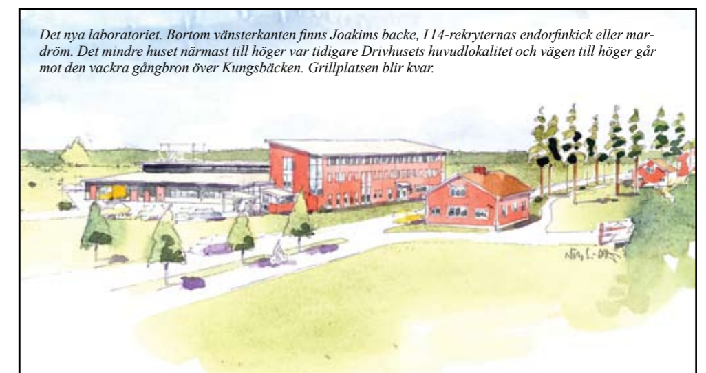
Det nya laboratoriet. Bortom vänsterkanten finns Joakims backe, 114-rekryternas endorfinkick eller mar-dröm. Det mindre huset närmast till höger var tidigare Drivhusets huvudlokalitet och vägen till höger går mot den vackra gångbron över Kungsbäcken. Grillplatsen blir kvar.

Ägare till byggnaden kommer att vara Norrporten AB, samma