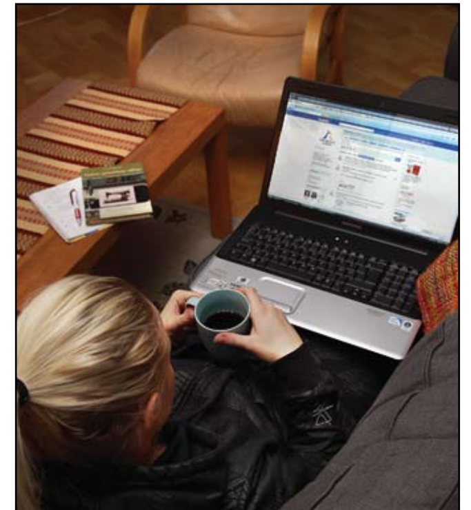
Vi måste tänka till på vad som händer när undervisningen flyttar till sociala medier utanför Högskolans kontroll, menar skribenterna.

Det fysiska klassrummet är en avskild laboriemiljö där studerande och lärare prövat olika tankar. Blackboard kräver också registrering och fungerar som ett avgränsat "rum". Men vad händer när vi går utanför dessa miljöer och in i nya, öppna sociala medier? Eller medier utanför HiG:s kontroll? Användningen