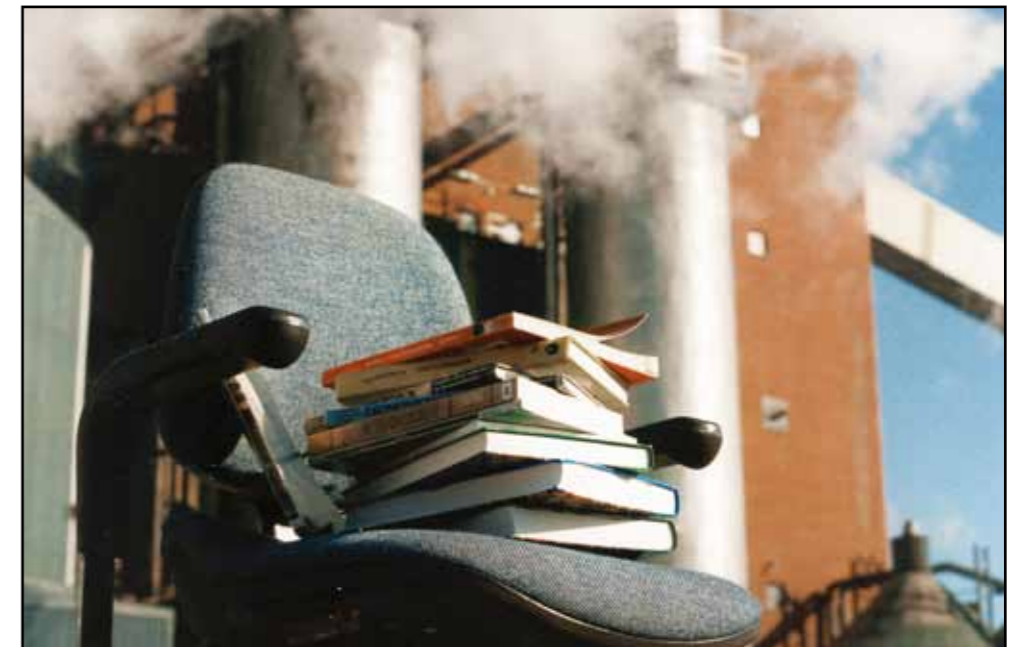
En stor mängd aspekter av arbetsliv, i fysiskt, psykiskt, organisatoriskt och socialt perspektiv, tas upp i den breda masterutbildningen. Man fokuserar mer på hur den goda arbetsplatsen skapas men även hur den dåliga uppstår. Deltagarna har goda möjligheter att arbeta vid sidan av studierna vilket har bäddat för större studentunderlag.