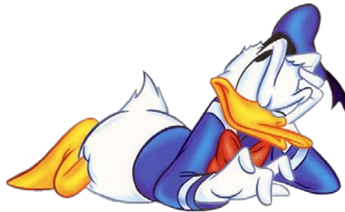
Fig. 1. Den moderna elektronikers fader [2].

Figurer är alla grafiska element, såsom fotografier, diagram av alla sorter, kretsscheman, blockscheman med mera och kallas Figur i beskrivningstexten, se under Fig. 1. Men när man hänvisar till figuren från sin text skriver man bara förkortningen "Fig." till exempel "I Fig. 4 ser man..." eller "... jämför Fig. 5 och 6 ser man att...". Om "Fig." inleder en mening skriver man ut hela ordet så här: "Figur 1 visar..."