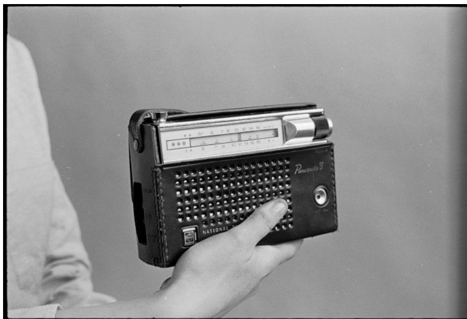
Fig. 2. En "Transistor", som den transistorbaserade radion kallades under 1960- och 1970-talet [2]. (Observera att här dyker referens [2] upp en gång till – eftersom vi kommer med ett nytt påstående som inte hänger ihop med det förra.)

(Det här ser ju inte särskilt snyggt ut! Att avsluta ett avsnitt med en figur ensam på en sida är inte bra. Försök att arrangera om texten om det skulle råka hända.)