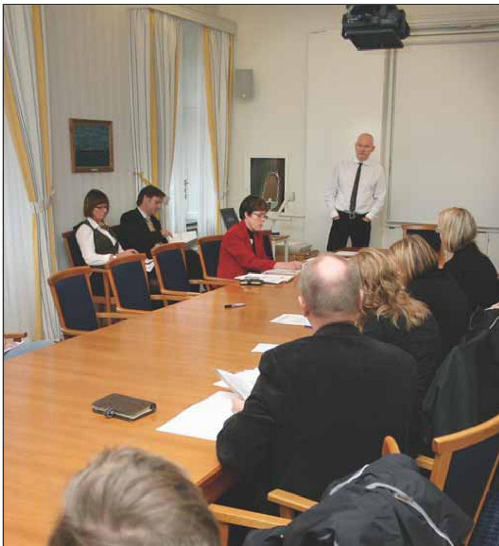
Presskonferensen om Kinautredningen lockade flera intresserade mediarepresentanter till styrelserummet.

"Mot bakgrund av vad som framkommit i utredningen får därför framförda påståenden om korruption och andra oegentligheter vid HiG eller annorstädes, med anknytning till Kinaprogrammet, anses sakna grund."