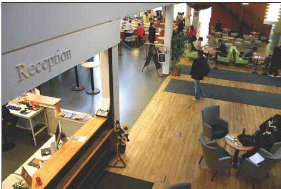
Vackert men hög ljudnivå är det i Studentcentrum. Nu ska åtgärder mot bullret vidtas.

– En akustiker har varit här och talat om för oss vilken väg ljuden tar i lokalen och föreslagit åtgärder. Ljuden kan delas in i två typer, sorl och stötljud, som kräver olika åtgärder.