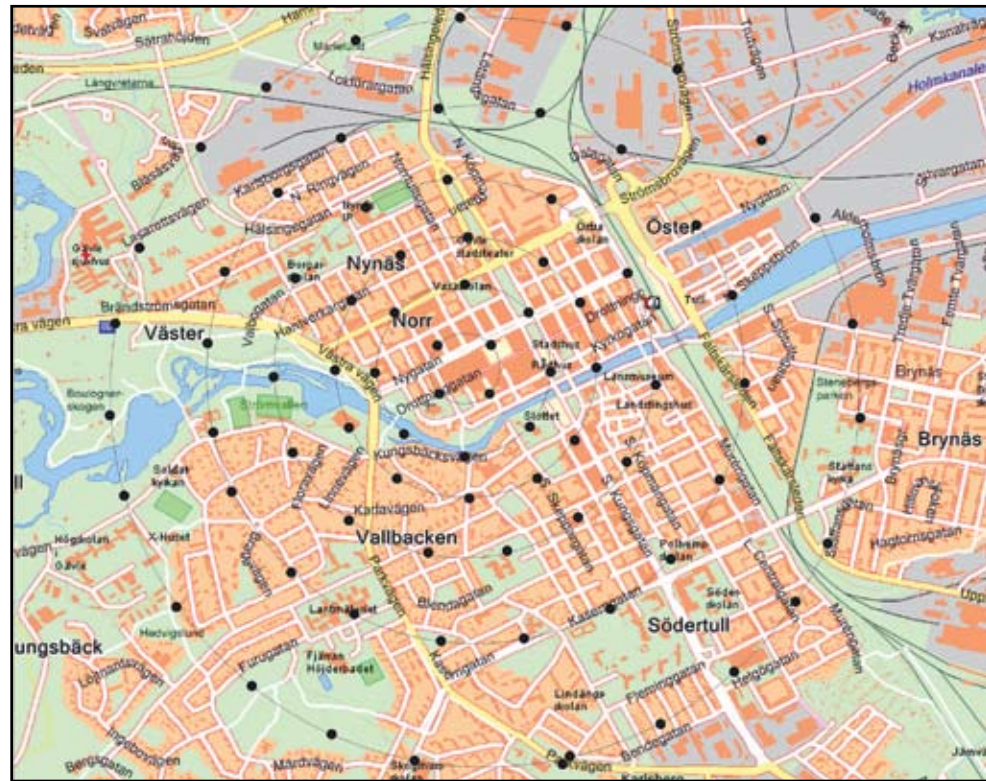
De svarta punkterna på kartan motsvarar placeringen av de givare som ger uppgifter till en data bas ur vilken klimatförhållandena sedan kan hämtas för presentation på kommunens hemsida, för användning i undervisning och av studenter i examensarbeten samt för forskningssyften.

I ett unikt forskningsprojekt planeras staden Gävle att förvandlas till en stor area för mätningar av klimatet.