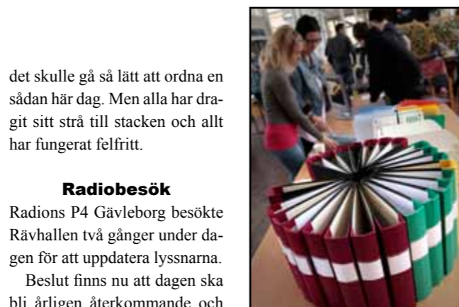
Alltid användbart är kontorsmaterial som pärmar och plastfickor. Kostar det en spottstyver är det ännu trevligare. Även datorerna betingade ett pris som lämpade sig för spontanköp, 150 kronor,